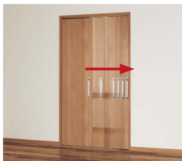
戸先側ソフトクローズ機構