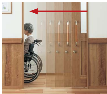
自閉機構 タイムラグ自閉機構 フリーストップ自閉機構 自閉機構(フリーストップなし)